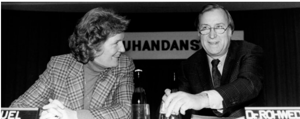
Birgit Breuel und Dr. Detlev Karsten Rohwedder

Wir schreiben das Jahr 2019. 30 Jahre ist der Mauerfall bereits her. Zwei Glieder einer Völkerfamilie haben es geschafft sich friedlich wiederzuvereinigen. Darauf dürfen wir ruhig stolz sein. Besonnene Kräfte auf beiden Seiten haben dieses Wunderwerk in einem schmalen Zeitfenster von gerade mal 6 Wochen möglich gemacht.